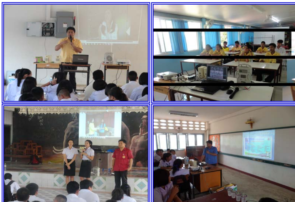
ภาพการใช้สื่อในการแนะแนวการศึกษาของวิทยาลัยเทคนิคท่าหลวงฯ ประจำปีการศึกษา 2558

เนื่องจากในภาคเรียนที่ 2 ของทุกปีการศึกษา ทางงานแนะแนวฯ วิทยาลัยเทคนิคท่าหลวงฯ จะออกทำการแนะแนวการศึกษา ตามโรงเรียนต่างๆ ในเขตจังหวัดสระบุรีและจังหวัดพระนครศรีอยุธยา โดยในการออกแนะแนวแต่ละครั้งสื่อที่ใช้ในการแนะแนวประกอบด้วย โปรเจ็คเตอร์ ชุดลำโพง เครื่องเสียงขนาดเล็ก และคอมพิวเตอร์โน้ตบุ๊ค แต่เนื่องจากสื่อดังกล่าวทางงานแนะแนวฯ ยังไม่มีเป็นของงานแนะแนวฯ ในการออกแนะแนวแต่ละครั้งต้องยืมแผนกวิชาและงานต่างๆ ในบางครั้งทำให้การแนะแนวไม่มีสื่อที่ใช้ครบสมบูรณ์ ทำให้ประสิทธิภาพในการแนะแนวก็ลดลง ดังนั้น เพื่อให้การแนะแนวฯ มีประสิทธิภาพเพื่อส่งผลให้ยอดนักเรียน นักศึกษา ของวิทยาลัยเทคนิคท่าหลวงฯ เขตไทยอนุสรณ์มีจำนวนเพิ่มมากขึ้น งานแนะแนวฯ จึงจัดทำโครงการพัฒนาสื่อการแนะแนวการศึกษาต่อวิทยาลัยเทคนิคท่าหลวงฯ ขึ้น