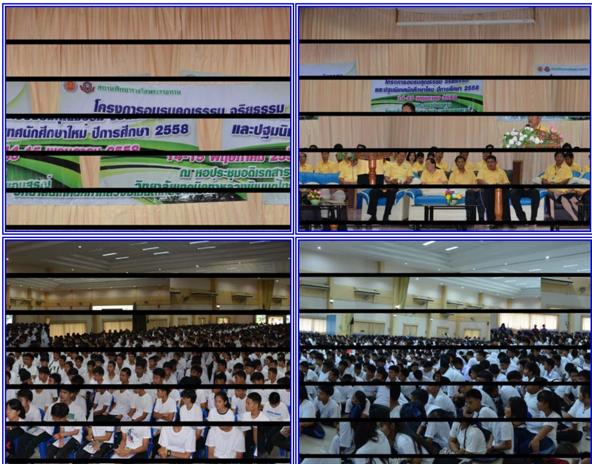
ภาพโครงการอบรมคุณธรรม จริยธรรม และปฐมนิเทศนักเรียน นักศึกษาใหม่ ประจำปีการศึกษา 2558

ตามนโยบายของสำนักงานคณะกรรมการการอาชีวศึกษา ได้กำหนดให้มีการอบรมคุณธรรม จริยธรรม แก่นักเรียน นักศึกษาใหม่ เป็นประจำทุกปีการศึกษา เพื่อให้นักเรียนได้ตระหนักถึงคุณธรรม จริยธรรม ให้เพิ่มมากขึ้น และเพื่อให้นักเรียน นักศึกษา ได้รับข้อมูลเบื้องต้นเกี่ยวกับการปฏิบัติตนในระหว่างที่ศึกษาอยู่ที่วิทยาลัยเทคนิคท่าหลวงซิเมนต์ไทยอุบลราชธานี